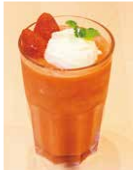
いちごのスムージー