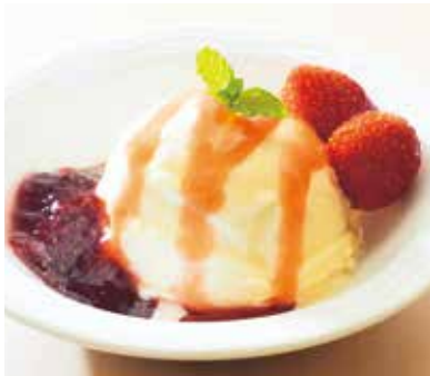
自家製ジャム添えジェラート